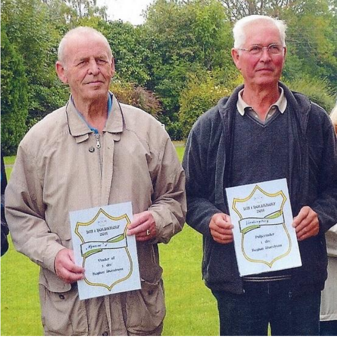
Kaptajnerne med diplomerne.

Der var nu ingen tvivl, for Nyserne satte det hele på plads fra starten, og da doublerne var færdige, førte de 8-0. Vordingborg vandt en damesingle, men resten tog Nyserne sig af, så det endte med en Nyser sejr på 14-2.