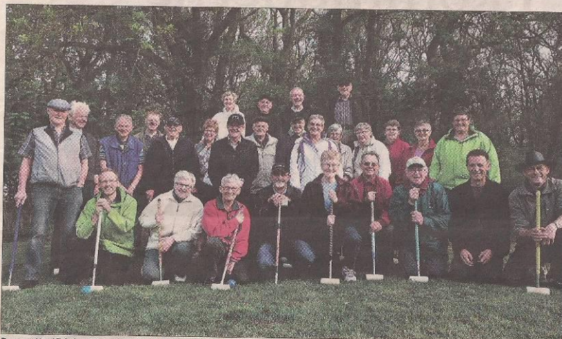
Brørup Krolfklub stiller med 28 spillere ved par-VM, der spilles på Brørup Stadion den 18. juni. Om aftenen arrangeres der fællesspisning for alle krolfinteresserede.