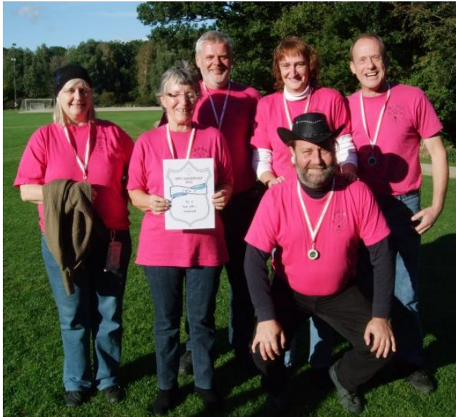
Sølv: KØK 7