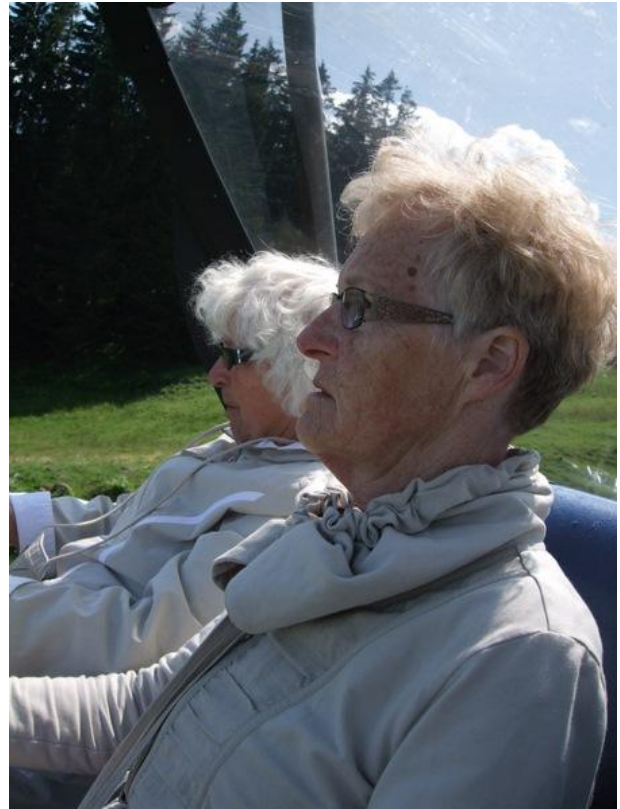
Ikke alle synes tovbaner er lige fornøjelige. Nogle har et anstrengt forhold til dem, og andre falder i søvn.