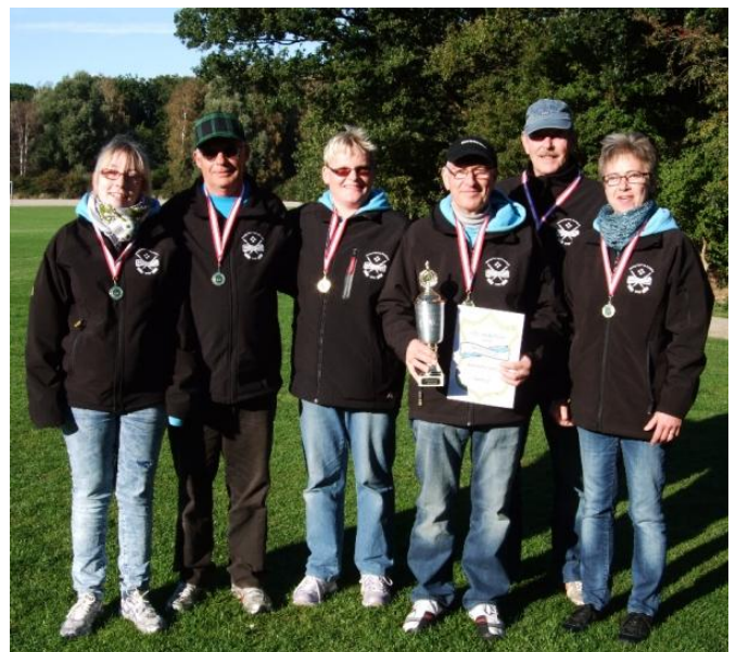
Guld: Baskerne 2

KØK 7 og Nyserne 1's kamp endte 8-8 og da de begge havde tabt 10-6 til Baskerne, var vi nødt til at tælle slag, og her havde KØK 7 brugt 399 slag mod Nysernes 402, så det blev altså sølv til KØK 7 og bronze til Nyserne 1.