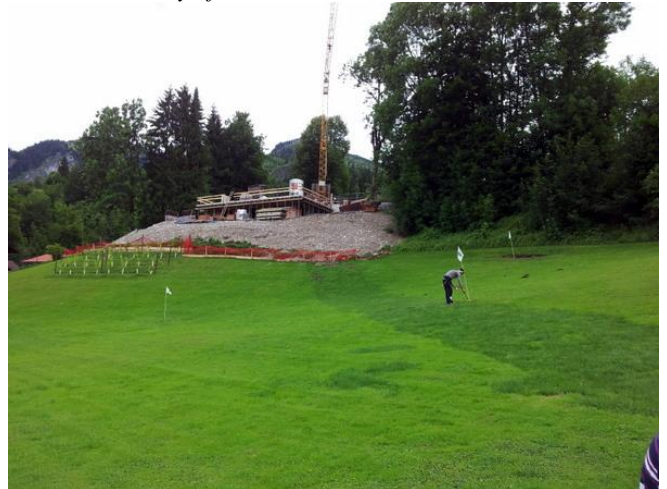
Nyt hus er også på vej.