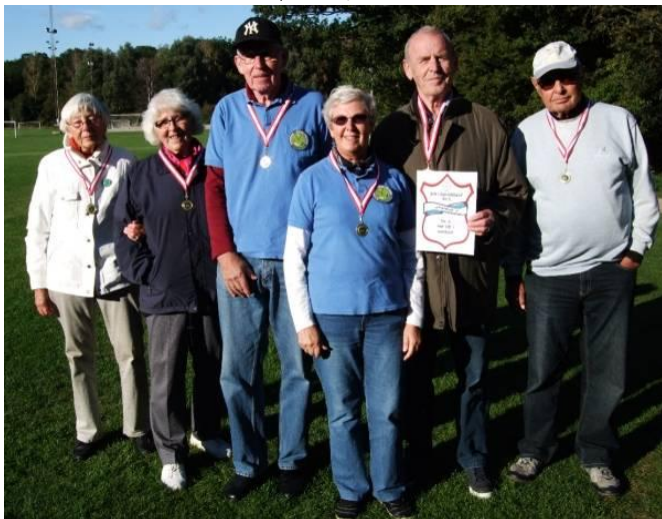
Bronze: Nyserne 1