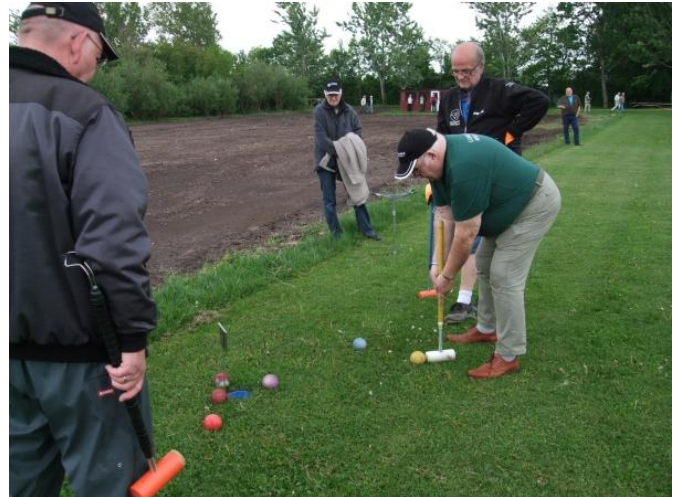
Der var trængsel ved nogle huller