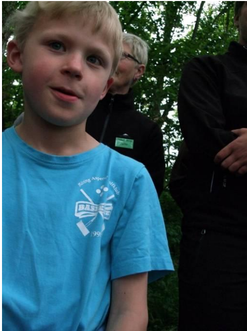
Og en lille Basker der er på vej mod store triumfer