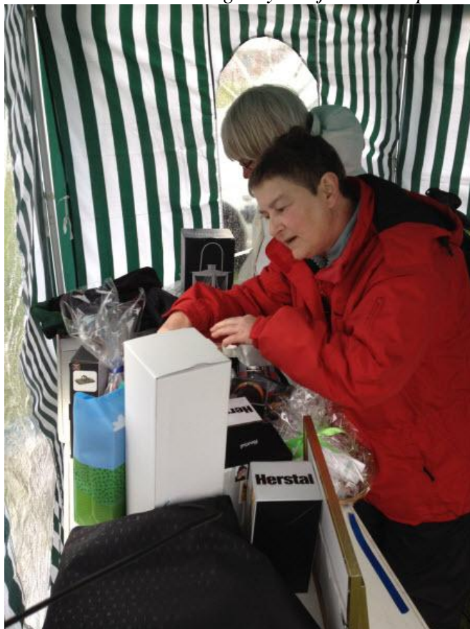
Og sørme om ikke der var gevinst.