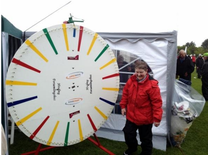
Lundsmark havde også lykkehjul stillet op.