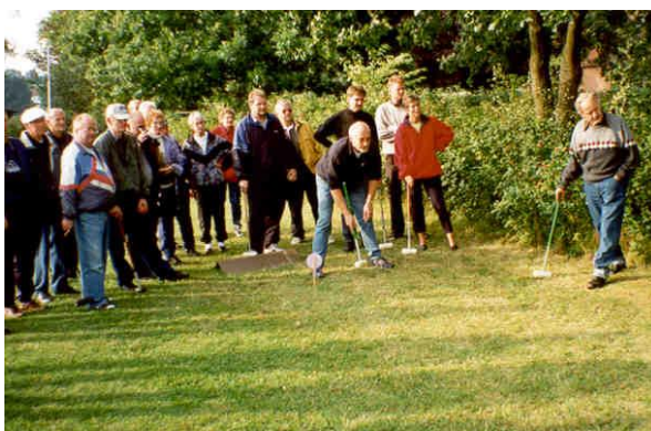
Bent på vej til hul 5.