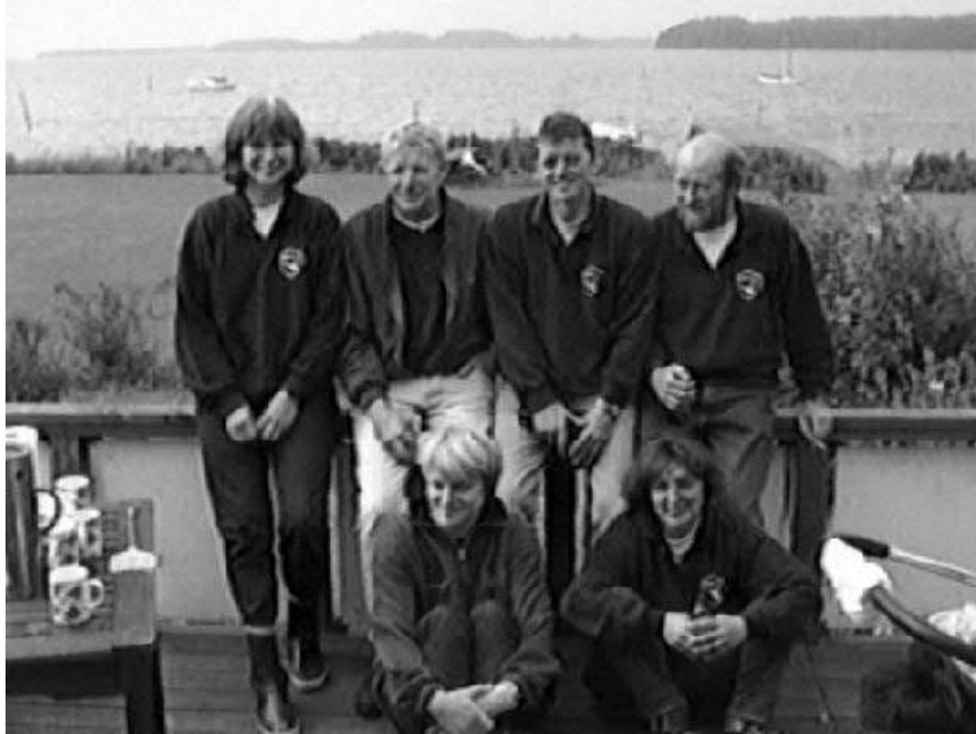
Vigo'e 1 rykker op