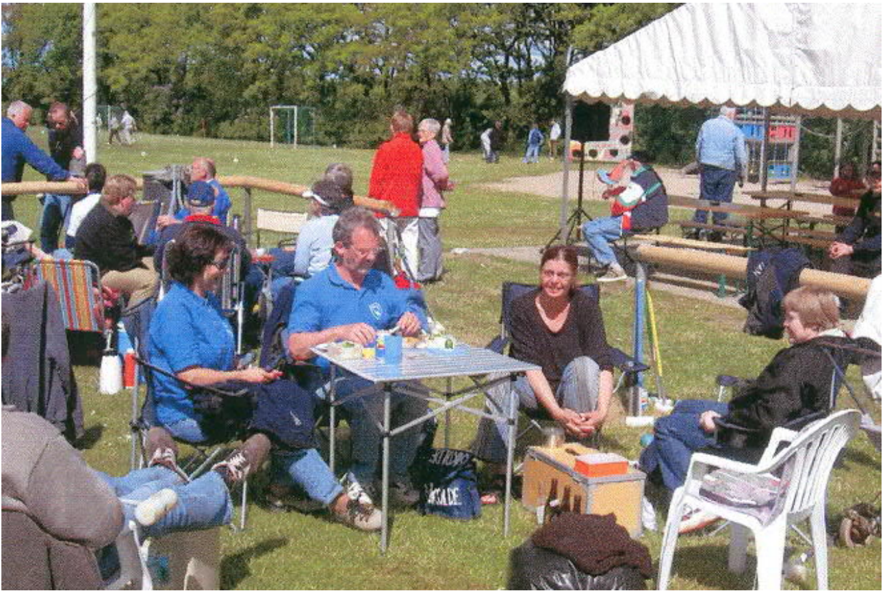
ViGo'e ved DM 2004