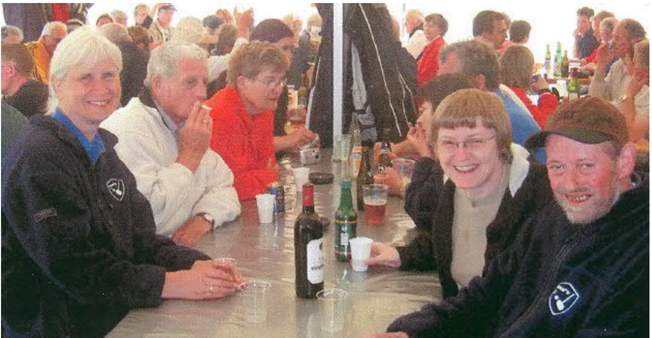
DM 2004 i Tiset