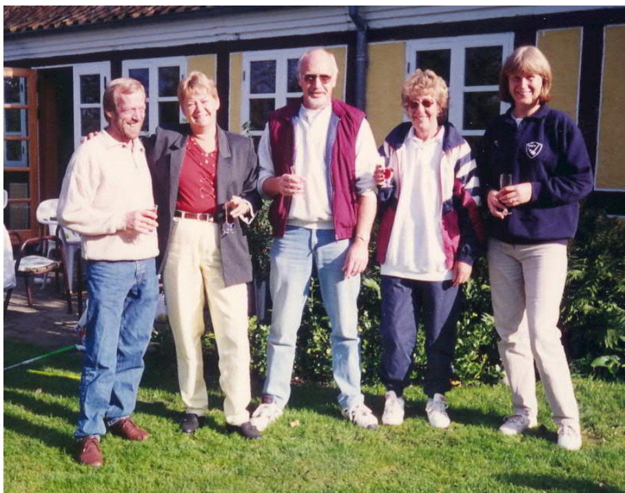
ViGo'e 3 rykker op i 1. division.

I 1996 spillede vi i divisioner fra starten af sæsonen. Her placerede et ViGo'e hold sig som vinder af 2. division A, og skulle hermed rykke op i 1. division. næste år. De havde vundet alle 6 kampe i turneringen.