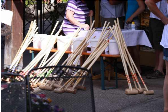
Det er alm. havekroket køller med langt skaft

Der er næsten ikke forskel på danske og tyske regler, men udstyret er anderledes. Det er trækøller med 1 m langt skaft uden ordentligt slag i og mindre og lettere kugler. Det gør at det hele er uvant og trægt i forhold til vores udstyr, men det er ved dette stævne ikke lovligt at spille med dansk udstyr.