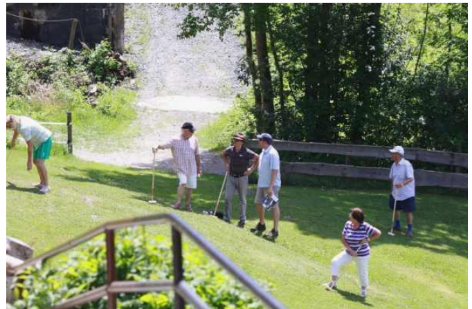
Her kan man ane hvor skævt landskabet er.

Om aftenen var der banket med alverdens grillerier. Der var fisk, kalkun, nakkekoteletter, ribben, lam og oksekød. Dertil var der salatbar, og flere forskellige slags kartofler. Til dessert var der is og alverdens frugt.