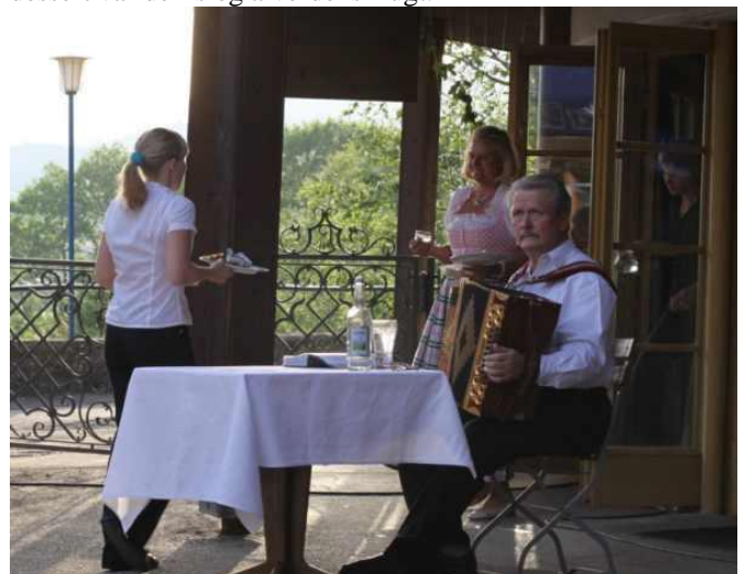
Der var harmonikamusik til maden - plus jodlen.

Om aftenen var der banket med alverdens grillerier. Der var fisk, kalkun, nakkekoteletter, ribben, lam og oksekød. Dertil var der salatbar, og flere forskellige slags kartofler. Til dessert var der is og alverdens frugt.