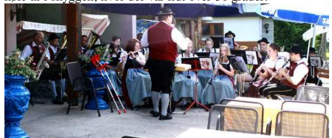
Det lokale tyrolerorkester spillede til frokost og krolfkampe.

Da anden omgang var spillet, skulle dommerne så spille 2 runder. Det var ikke at spøge med, for på det tidspunkt var der ca. 40 graders varme i solen, og det var helt umuligt at køle af i skyggen, hvor der var lidt over 30 grader.