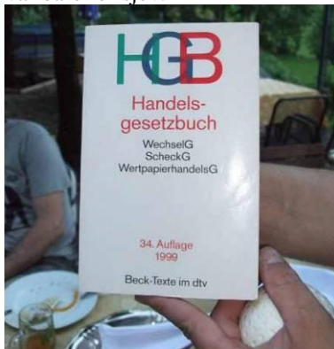
Handelslovbogen. En lovbog er vel en lovbog.

Om aftenen var der edsaflæggelse af dommerne. Det skulle have været på den Bayerske forfatning, men den havde forpuppet sig, men så brugte man bare Handelsgesetzbuch i stedet for. Det kunne lige så godt have været en kokebog, men det hele var bare for sjov.