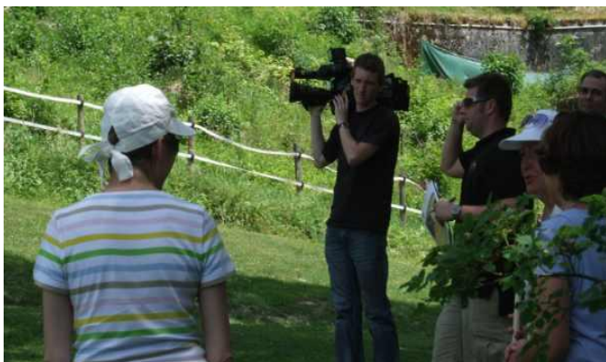
Og TV var også på plads.

Der skulle virkelig hamres til, så pigerne foretrak at skyde baglæns.